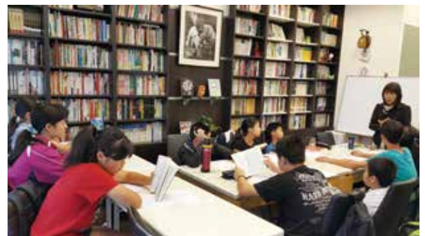
書房定期舉辦專屬青少年的讀書會